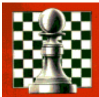
Comité Val d'Oisien des Echecs

Ce championnat, organisé par le Comité Val d'Oisien des Echecs (CVOE), porte très bien son nom car il se déroule le vendredi soir !